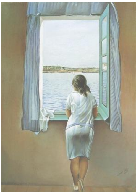
Dali "Das Mädchen am Fenster"

Besonderes: Die Teilnehmerzahl ist auf 22 Personen beschränkt.